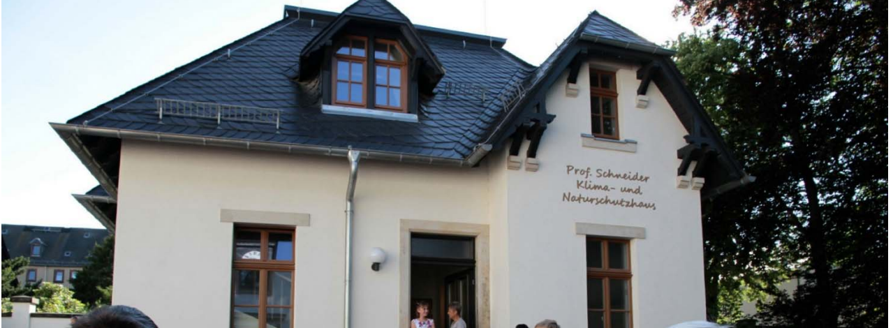
Enthüllung des Schriftzugs „Prof. Schneider Klima- und Naturschutzhaus“ am „Torwärterhaus“ des Gymnasiums Prof. Dr. Max Schneider

Das Traditionelle Hofkonzert war wieder ein großer Erfolg und ein Publikumsmagnet, wie die Impressionen zeigen.