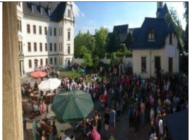
Impressionen des Hofkonzerts vom 21.06.2019

Karl-Max-Schneiderstiftung, Lichtenstein 21.06.2019